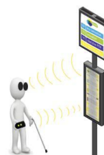
Poteau d'arrêt de bus Gayant, Urbanéo

Trophée éco-conçu qui a donné l'opportunité aux élèves de la licence pro Eco-conception des Produits Innovants de l'Université Lille 1 de mettre leurs connaissances théoriques au service d'une problématique concrète d'éco-conception. Des idées pour 2014?