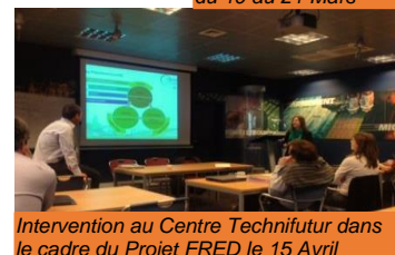
Intervention au Centre Technifutur dans le cadre du Projet FRED le 15 Avril