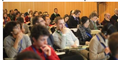
Atelier Congrès [avniR] 2013

La 3 ème édition du Congrès [avniR] nous a permis de comprendre non seulement comment l'outil ACV peut être mis en pratique dans les démarches d'éco-conception, dans la stratégie de développement des filières industrielles ou tertiaires mais aussi en quoi il est un levier influent pour passer à des achats responsables grâce à un affichage environnemental plus rigoureux.