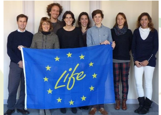
Kick-off meeting LCiP 12 Novembre 2014

En avril dernier, la Commission Européenne annonçait le lancement d'une expérimentation de trois ans pour harmoniser les modes de calcul et de communication de l'impact environnemental à l'échelle de l'Europe. Une recommandation invitait les Etats membres de l'UE à adopter les méthodes PEF (Product Environmental Footprint) pour calculer l'empreinte environnementale des produits. Sur 90 candidatures reçues, 14 projets ont été sélectionnés par la Commission européenne dont celui du cd2e sur les produits d'isolation thermique des bâtiments. Le cd2e, soutenu par ses partenaires du projet CAP'EM et la Plateforme [avniR], est chef de file pour la mise en place et la validation du référentiel pour la catégorie de produits « matériaux d'isolation thermique des bâtiments ».