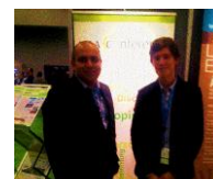
Intervention à Americana, Canada du 19 au 21 Mars

En parallèle, la Plateforme [avniR] a contribué à la mise en place de l' annuaire éco-conception avec l'ADEME , à la traduction du « Guide sectoriel d'éco-conception » ciblé sur les matériaux de construction, aidé au montage du projet de ressource pédagogique numérique intitulé ECOPEM « Cas concret : ECO-conception et étude environnementale de produits énergivores : application à un Produit de grande consommation de type Petit Electro-Ménager » et a également été interviewée par Actu-Environnement dans le dossier « L'éco-conception promise à un bel avenir ».