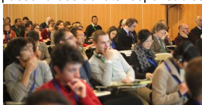
Atelier Congrès [avniR] 2013

La 3 ème édition du Congrès [avniR] nous a permis de comprendre non seulement comment l'outil ACV peut être mis en pratique dans les démarches d'éco-conception, dans la stratégie de développement des filières industrielles ou tertiaires mais aussi en quoi il est un levier influent pour passer à des achats responsables grâce à un affichage environnemental plus rigoureux.