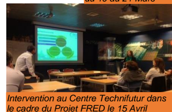
Intervention au Centre Technifutur dans le cadre du Projet FRED le 15 Avril