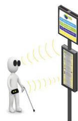
Poteau d'arrêt de bus Gayant, Urbanéo

Trophée éco-conçu qui a donné l'opportunité aux élèves de la licence pro Eco-conception des Produits Innovants de l'Université Lille 1 de mettre leurs connaissances théoriques au service d'une problématique concrète d'éco-conception. Des idées pour 2014?